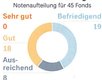
Fonds mit ETF-Strategien